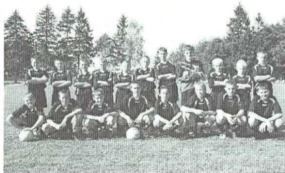
GŁAZ TYCHOWO 2007/2008

Rekrutacja odbędzie się 13 sierpnia 2008 o godzinie 17.00 na stadionie sportowym w Tychowie