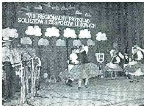
II miejsce Pomorzanie z Stramnicy