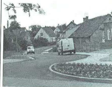
Tak wygląda nowa ul. Parkowa