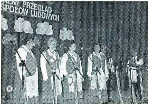
III miejsce Radość z Tychowa