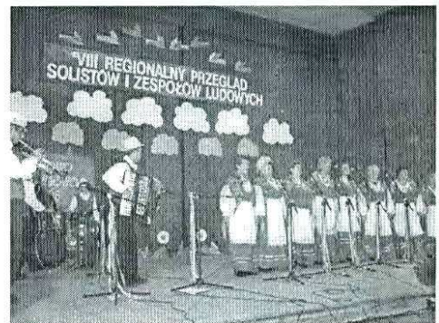
I miejsce Kalina z Kobyłanki